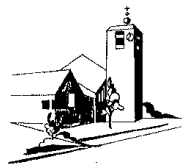
Pfarrgemeinde Maria Königin